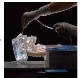
気管支部位への到達確認