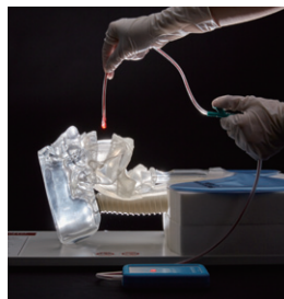
梨状窩部位の吸引位置確認

ピンポイントに通過地点をライトアップすることができるLED付き専用カテーテルを付属。さまざまな吸引における人体内部のチューブの動きを体感することができます。