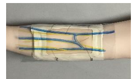
静脈神経シート装着図

様々な静脈注射トレーニングに対応できる注射パッドを開発、搭載しました。テープの固定はもちろん、逆血確認もOK。付属のシートを装着する事で解剖知識習得にも最適です。