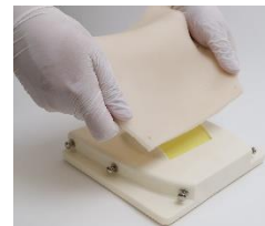
Attaching or replacing the epidermis