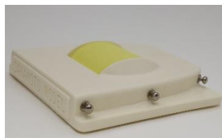
Muscle sponge set