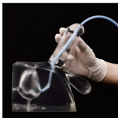
60°で次のカーブを越え膀胱に達する