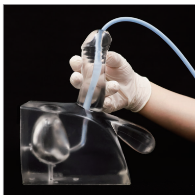
90°で最初のカーブを越える