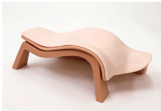
専用台を使って一人での実習も可能です。