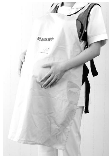
エプロン (別売) 装着時