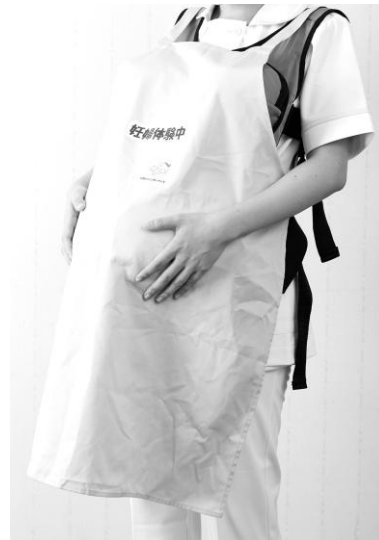
When apron (sold separately) is worn