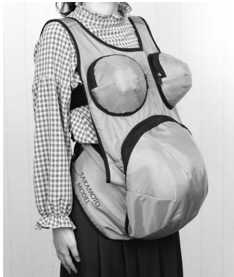
When fully fitted

(There are 8 waist weights and 2 chest weights.)