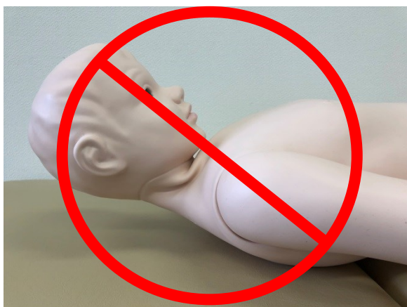
首を曲げて長期間保管しない