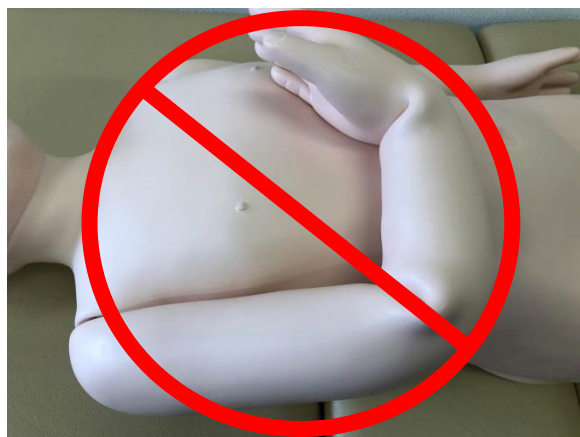
腕や手首を曲げて長期間保管しない