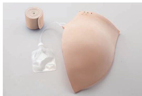
コンパクトで置き場所に困りません。