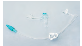
模擬胃ろうカテーテル