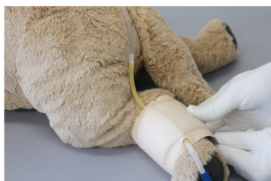
※外側伏在静脈部への装着時