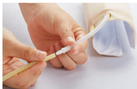
※血管のサイズは1.8mm,3mmの2種類でご使用頂けます